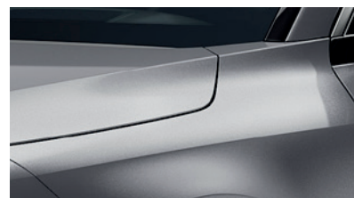
Steel Grey (KLG)** (Disponible en option sur Pace avec montant arrière noir) (Met zwarte achterstijl - beschikbaar als optie op Pace)