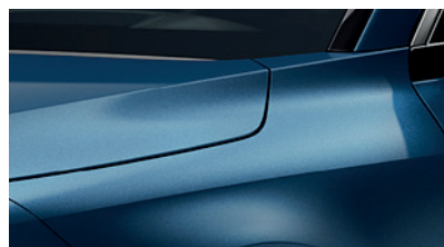
Mineral Blue (M4B)** (Disponible en option sur Pace avec montant arrière noir) (Met zwarte achterstijl - beschikbaar als optie op Pace)