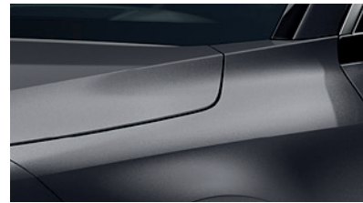
Interstellar Grey (AGT)** (Disponible en option sur Pace avec montant arrière noir) (Met zwarte achterstijl - beschikbaar als optie op Pace)