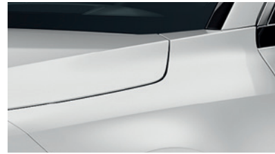
Snow White Pearl (SWP)** (Disponible en option sur Pace avec montant arrière noir) (Met zwarte achterstijl - beschikbaar als optie op Pace)