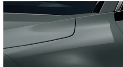
Cityscape Green (CGE)** (Disponible en option sur Pace avec montant arrière noir) (Met zwarte achterstijl - beschikbaar als optie op Pace)