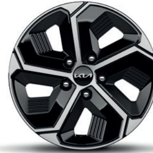
Jantes en alliage 16" avec pneus 205/60 R16 (de série sur Pure & Pulse, option sur Pace (PHEV)) 16" lichtmetalen velgen met banden 205/60 R16 (standaard op Pure & Pulse, optie op Pace (PHEV))