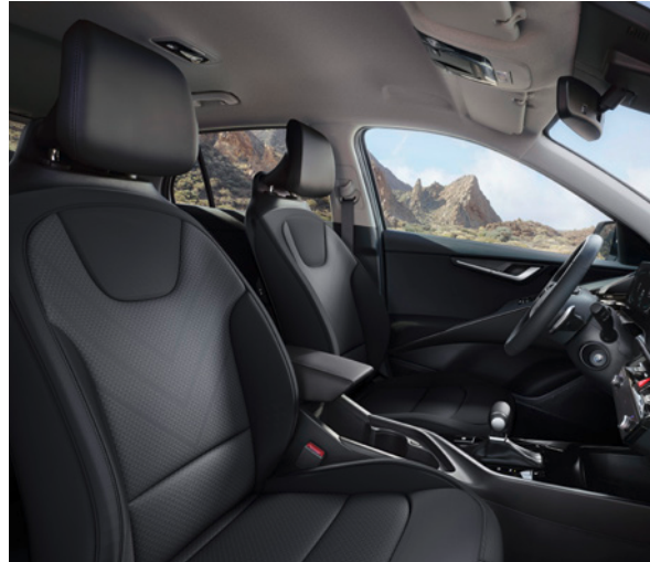
Tissu - Noir (de série sur Pure) Stof - Zwart (standaard op Pure)