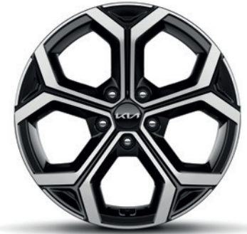
Jantes en alliage 18" avec pneus 225/45 R18 (de série sur Pace) (PHEV perte d'autonomie moyenne de 6 km) 18" lichtmetalen velgen met banden 225/45 R18 (standaard op Pace) (PHEV gemiddeld verlies van 6 km autonomie)