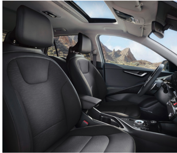
Cuir artificiel - Noir (de série sur Pace) Kunstleder - Zwart (standaard op Pace)