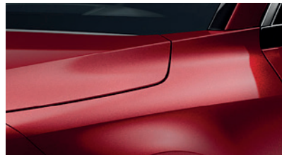
Runway Red (CR5)** (Disponible en option sur Pace avec montant arrière noir) (Met zwarte achterstijl - beschikbaar als optie op Pace)