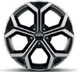
18" lichtmetalen velgen met banden 225/45 R18 (standaard op Pace) (PHEV: verlies van elektrisch rijbereik van ong. 5 km)