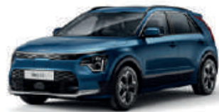
Mineral Blue (M4B)** (Met zwarte achterstijl - beschikbaar als optie op Pace)