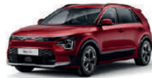
Runway Red (CR5)** (Met zwarte achterstijl - beschikbaar als optie op Niro EV Pace)