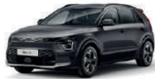
Interstellar Grey (AGT)** (Met zwarte achterstijl - beschikbaar als optie op Niro EV Pace)