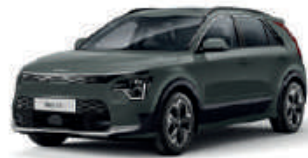
Cityscape Green (CGE)** (Met zwarte achterstijl - beschikbaar als optie op Pace)