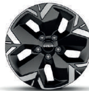
17" lichtmetalen velgen met banden 215/55 R17 (standaard)