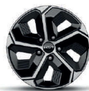
16" lichtmetalen velgen met banden 205/60 R16 (standaard op Pure & Pulse, optie op Pace (PHEV))