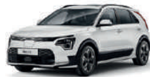
Snow White Pearl (SWP)** (Met grijze achterstijl - beschikbaar als optie op Niro EV Pace*** en met zwarte achterstijl - beschikbaar als optie op Niro EV/HEV/PHEV Pace)