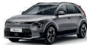
Steel Grey (KLG)** (Met zwarte achterstijl - beschikbaar als optie op Niro EV Pace)