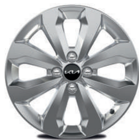
16" lichtmetalen velgen (standaard op Pulse)