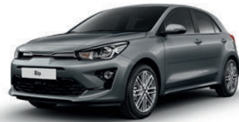
Perennial Grey [PRG]