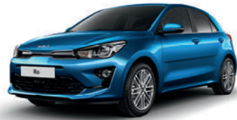
Sporty Blue [SPB]