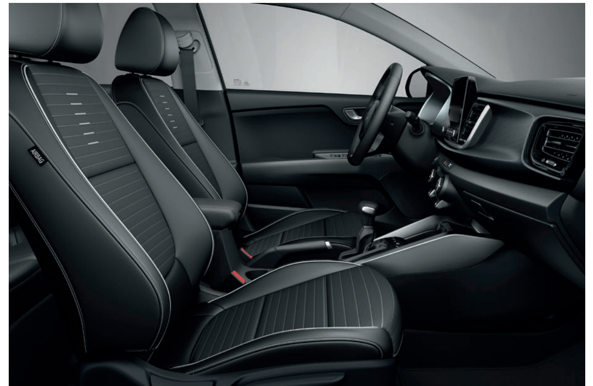
Zwart interieur met half kunstlederen + half stoffen zetels (standaard op GT Line)