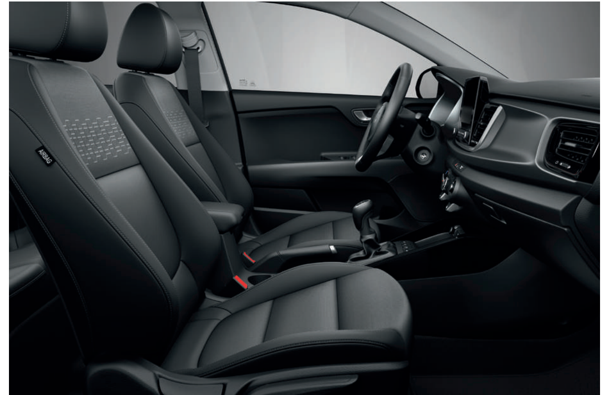
Zwarte stoffen zetelbekleding (standaard op Pulse)