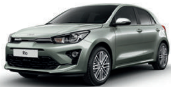
Urban Green [URG] (niet beschikbaar op GT Line)