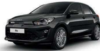
Aurora Black Pearl [ABP]