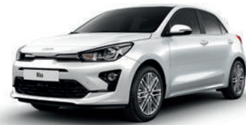
Clear White [UD]**