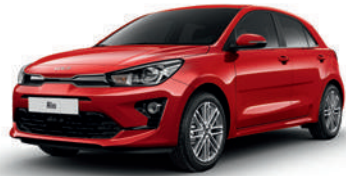
Signal Red [BEG]