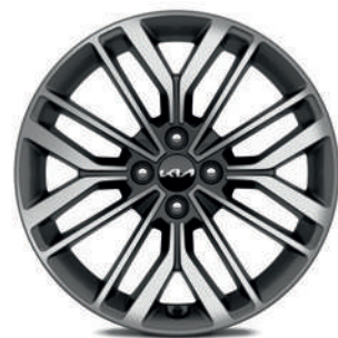
17" lichtmetalen velgen met 205/45 banden (standaard op GT Line)