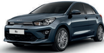
Smoke Blue [EU3] (niet beschikbaar op GT Line)