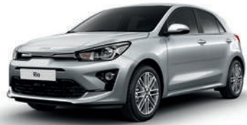
Silky Silver [4SS] (niet beschikbaar op GT Line)