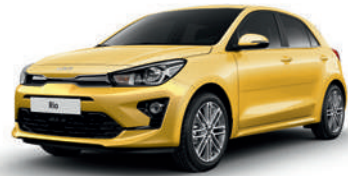
Most Yellow [MYW]