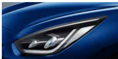
Yacht Blue (DU3)**