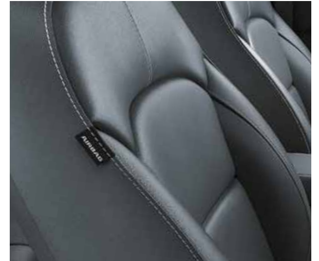
Grijze lederen zetelbekleding (optie op More via Luxe Pack)