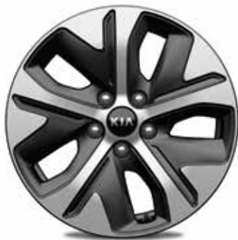
17" lichtmetalen velgen met 215/55 banden