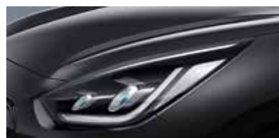
Interstellar Gray (AGT)**