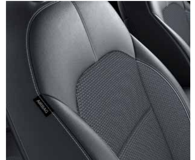
Grijze halflederen / halfstoffen zetelbekleding (standaard op Must en More)