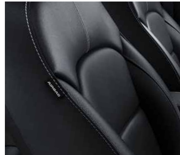
Zwarte kunstlederen zetelbekleding (standaard op e-Xtra Edition)