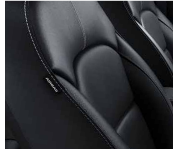
Zwarte lederen zetelbekleding (optie op More via Luxe Pack)