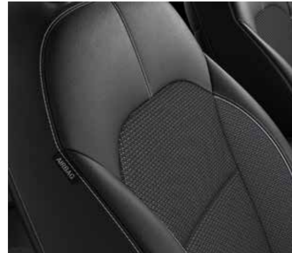
Zwarte halflederen / halfstoffen zetelbekleding (standaard op Must en More)