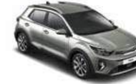
Urban Green _ URG