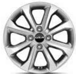
15" lichtmetalen velgen Pure