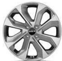
17" lichtmetalen velgen Inbegrepen in Leather Pack op Pulse