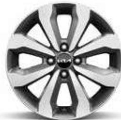
16" lichtmetalen velgen Pulse - Business Line