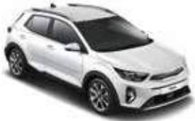
Clear White _ UD**