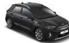
Aurora Black Pearl _ ABP