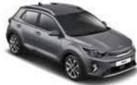
Perennial Gray _ PRG