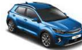
Sporty Blue _ SBP