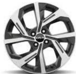
17" lichtmetalen velgen GT Line