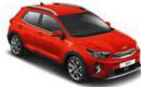
Signal Red _ BEG