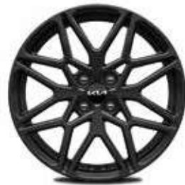
17" zwarte lichtmetalen velgen Black Edition