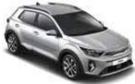
Silky Silver _ 4SS